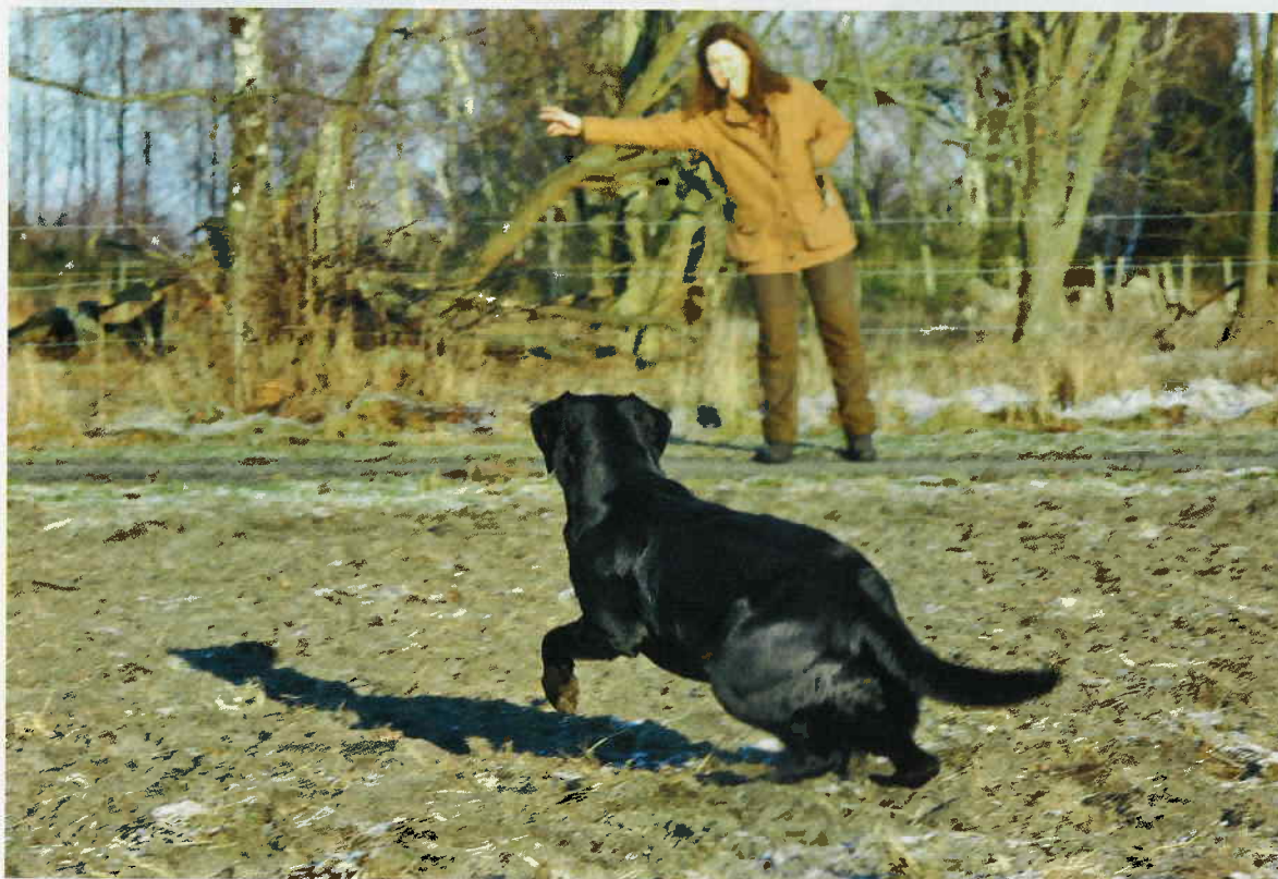
Lägg ut en dummy vid sidan av hunden (synlig). Dirigeringen görs med tydliga ljud- och kroppssignaler.

pekar, dit springer hunden. Där hittar den också något.